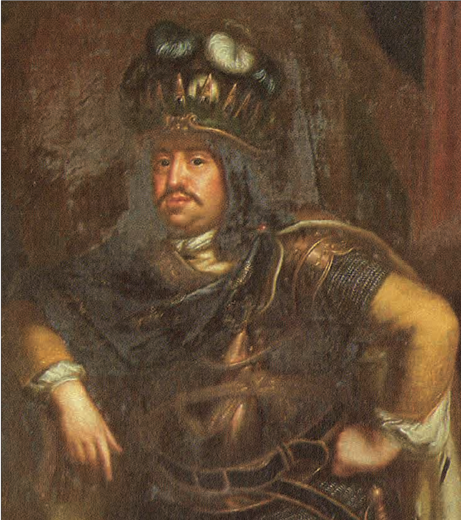
Figur 4. Carl 10. Gustav – aldrig har nogen person i historien været tættere på at udslutte Danmark som nation. Slaget ved Nyborg 1659 satte en stopper for hans planer. Uden den dansk/allierede sejr her, havde denne artikel været skrevet på svensk!

tilfredsstillelse, det var at vide, at hans mænd havde kæmpet godt.